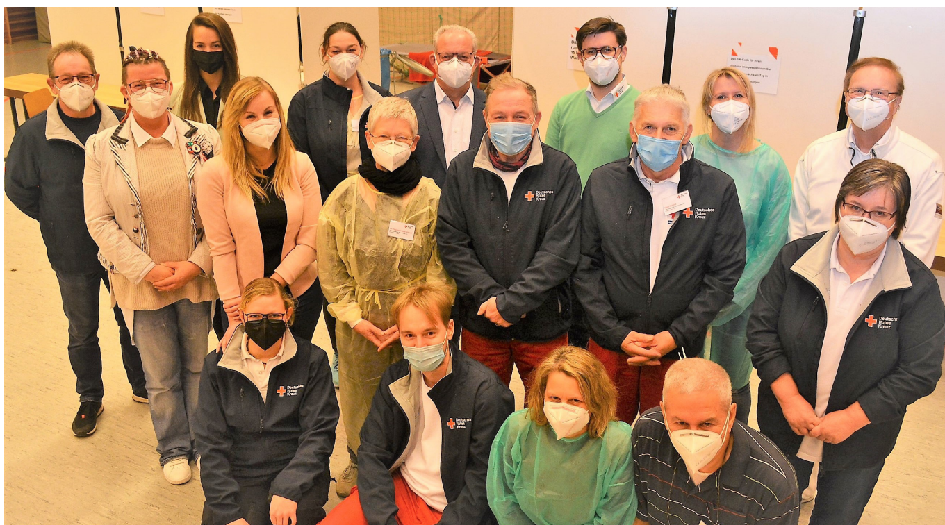
Das mobile Impfteam in Körle.

Zu einer Zahl von 10.000 gehört auch ein wenig Statistik, denn damit ein Impftermin, der für fünf Stunden angesetzt ist, reibungslos abläuft, sind eine ganze Reihe von Vor- und Nachbereitungen notwendig. Die Fahrzeuge werden vor der Abfahrt geholt und bestückt, dann werden Impfstoff und die notwendige digitale technische Ausrüstung abgeholt und danach beginnt die Reise zum Ort des Einsatzes. Hier braucht das Team eine Stunde, um den Aufbau vorschriftsmäßig zu erledigen, damit das Impfen pünktlich beginnen kann. Am Abend läuft dann der Film rückwärts ab und die Frauen und Männer des Teams waren zum Dienstende dann mindestens neun Stunden in Sachen mobiles Impfen unterwegs. Rund 3.500 Km wurden bei 44 Impfterminen bis zum 27.01. gefahren. Verbraucht wurden unter anderem 11.000 Spritzen, 22.000 Kanülen, 6.000 Nierenschalen, 13.000 Pflaster und 30 Liter Desin-