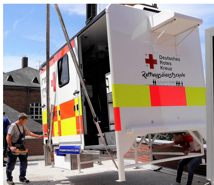
Der Kranführer setzt die Kabine ab.