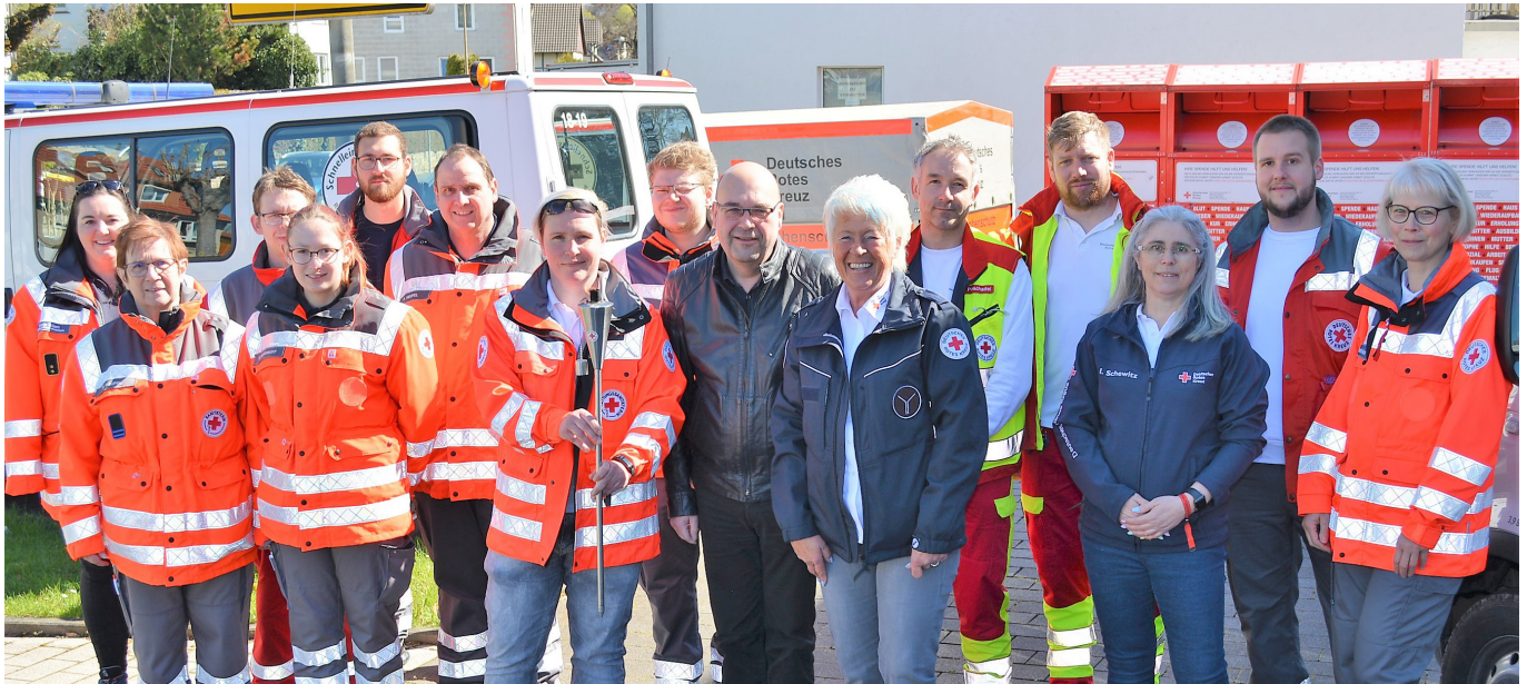
Mitglieder des Ortsvereins Rotenburg übergaben die Fackel an den Ortsverein Melsungen.

Schwalm-Eder. Solferino ist ein Ort in der italienischen Provinz Mantua, liegt knapp zehn Kilometer südlich vom Gardasee und hat auf den ersten Blick keinen Bezug zum DRK Kreisverband Schwalm-Eder. Betrachtet man jedoch den geschichtlichen Hintergrund der Kleinstadt, dann ist bald klar, woher die Verbindungen stammen, denn der Ursprung der Rotkreuzidee liegt in Solferino. Hier standen sich am 24. Juni 1859 bei der Entscheidungsschlacht im Sardischen Krieg zwischen dem Kaisertum Österreich und dem Königreich Piemont-Sardinien mit Frankreich als Verbündetem, jeweils rund 115.000 Soldaten gegenüber. Auslöser des Krieges war, dass die italienischen Freiheitskämpfer in den damaligen österreichischen Provinzen Lombardei und Venetien vom Königreich Piemont-Sardinien unterstützt wurden. Die Schlacht von Solferino gilt als eine der größten und wohl auch grausamsten des 19. Jahrhunderts. Der Schweizer Geschäftsmann und Humanist Henry Dunant, er gilt als Begründer der Internationalen Rot-Kreuz und Rothalmond-Bewegung, war zu diesem Zeitpunkt auf einer Reise in Nord-Italien und sah das blutige Schlachtfeld in der Umgebung von Solferino. In den Feldern lagen viele Tausend Verwundete, Sterbende und Tote. Die Sanitätsdienste waren überlastet und zu deren Unter-