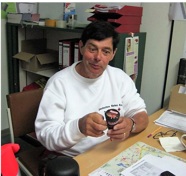
Hessentag in Homberg 2008.

Rückblickend sagt der sehr rüstige Rentner, der bei drei Hessentagen als Rot-Kreuz-Beauftragter eingesetzt war: „Ich habe mich über alle Veranstaltungen des Roten Kreuzes immer richtig gefreut, es hat Spaß gemacht und ich war gerne dabei. Die Arbeit beim DRK war ein Schwerpunkt meines bisherigen Lebens und ich denke oft gerne an vergangene Erlebnisse zurück.“