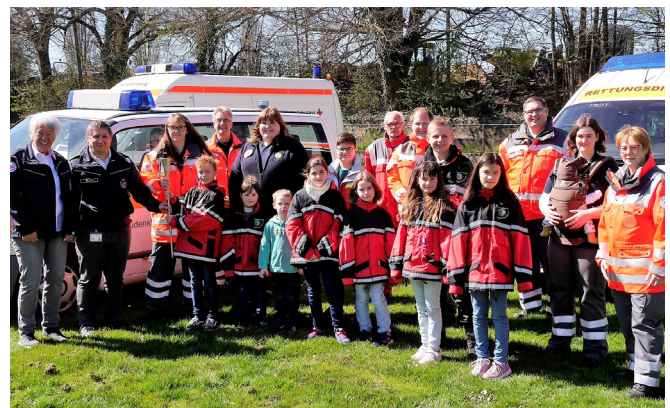
JRK Gudensberg übernimmt die Fackel.

Am 24. Juni 1992, dem Jahrestag der Schlacht, organisierte das Italienische Rote Kreuz zum ersten Mal zu Ehren von Henry Dunant und im Gedenken an die Schlacht einen Fackelzug von Solferino nach Castiglione, das einstige Kampfgebiet. Mittlerweile ist dieser Friedensmarsch zur Tradition geworden, und viele Tausende von Rotkreuzhelfern aus halb Europa nehmen jedes Jahr begeistert daran teil. Da nicht alle Rotkreuzlerinnen und Rotkreuzler an der Fiaccolata – insbesondere aufgrund der weiter anhaltenden Coronapandemie – teilnehmen können, hat das Deutsche Rote Kreuz den Fackellauf nach Solferino initiiert. Nach der Art eines Staffellaufs soll die Fackel von Rotkreuzgliederung zu Rotkreuzgliederung weitergereicht werden.