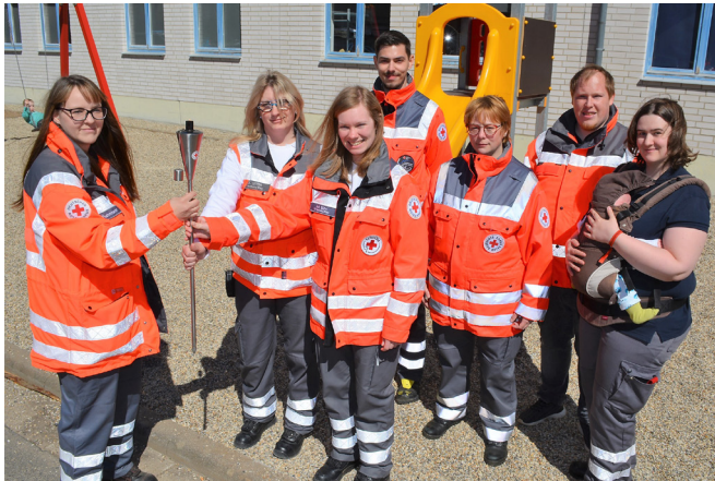
Der Ortsverein Homberg übernimmt die Fackel.

Das Deutsche Rote Kreuz (DRK), das vor einem Jahr seinen 100. Geburtstag feierte, startete den diesjährigen „Fackellauf nach Solferino“ am Sitz seines Generalsekretariats in Berlin. Bei der Aktion wurde ein „Licht der Hoffnung“ von Ehrenamtlichen durch die gesamte Bundesrepublik getragen. Es erreichte Ende Juni Italien, um dort an der sogenannten Fiaccolata, der