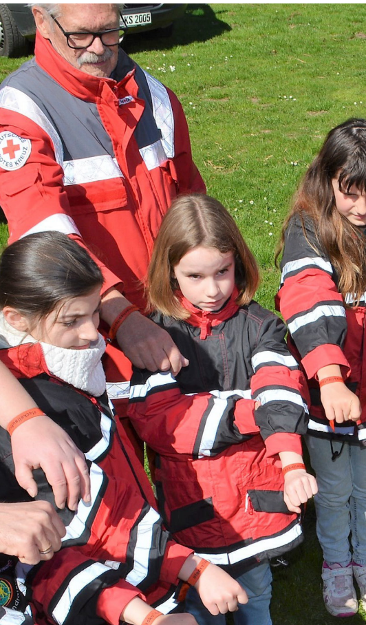
Titelbild: JRK Gudensberg bei der Übernahme der Fackel auf dem Weg nach Solferino. Näheres erfahren Sie auf Seite 20!