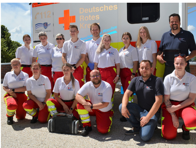
Auszubildende der Rettungsdienstschule mit Ausbildern.