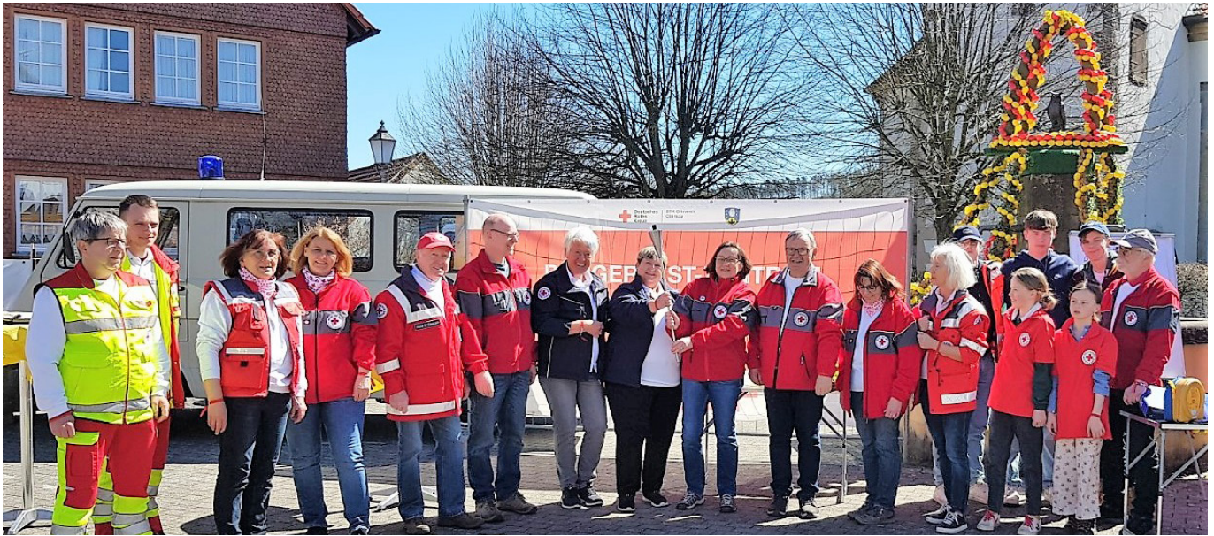
Die Fackel ist in Oberaula angekommen.

Am 24. Juni 1992, dem Jahrestag der Schlacht, organisierte das Italienische Rote Kreuz zum ersten Mal zu Ehren von Henry Dunant und im Gedenken an die Schlacht einen Fackelzug von Solferino nach Castiglione, das einstige Kampfgebiet. Mittlerweile ist dieser Friedensmarsch zur Tradition geworden, und viele Tausende von Rotkreuzhelfern aus halb Europa nehmen jedes Jahr begeistert daran teil. Da nicht alle Rotkreuzlerinnen und Rotkreuzler an der Fiaccolata – insbesondere aufgrund der weiter anhaltenden Coronapandemie – teilnehmen können, hat das Deutsche Rote Kreuz den Fackellauf nach Solferino initiiert. Nach der Art eines Staffellaufs soll die Fackel von Rotkreuzgliederung zu Rotkreuzgliederung weitergereicht werden.